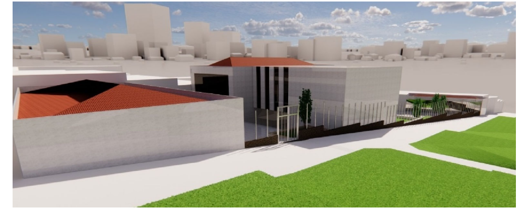
Imagen referencial -Servicios públicos complementarios de Educación