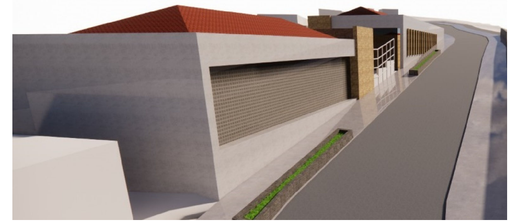
Imagen referencial -Servicios públicos complementarios de Salud